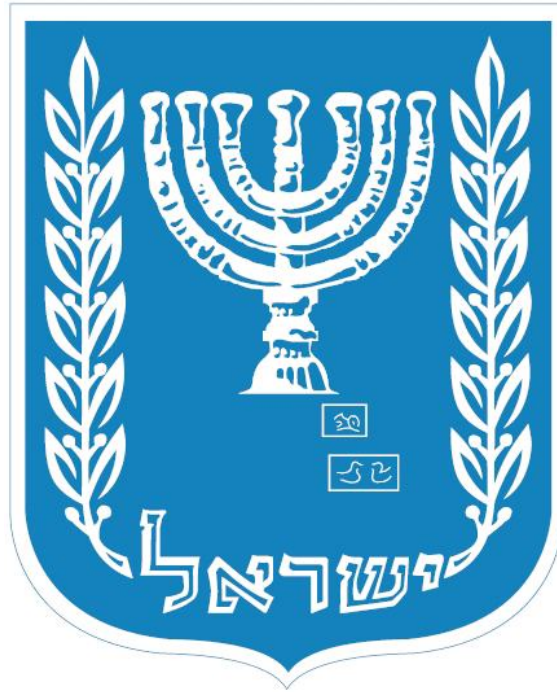
fig. Wapen van Israel. (Klik op de afbeelding om in te zoomen.)

Het Tempelinstituut in Jeruzalem heeft naast andere voorwerpen voor de tempeldienst ook een menora gemaakt die dienst moet gaan doen in de toekomstige tempel: