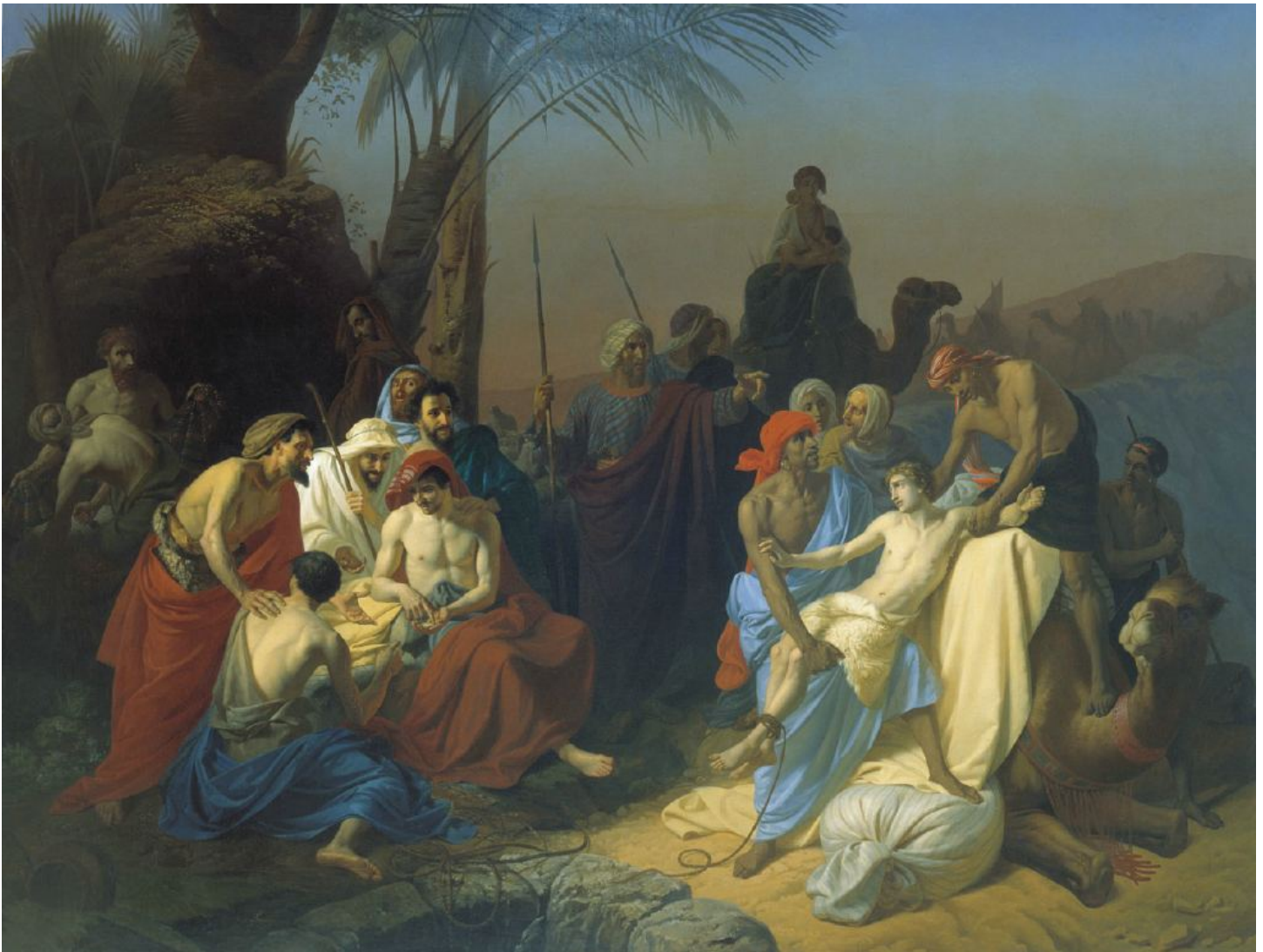
De kinderen van Jacob verkopen hun broer Jozef. Schilderij van Konstantin Flavitsky, 1855 [1] (klik op de afbeelding om deze te vergroten)

Ge 42:21 ... Werkelijk, wij zijn schuldig vanwege onze broer. Wij zagen zijn zielsbenauwdheid toen hij ons om genade smeekte, maar wij gaven hem geen gehoor! (HSV)