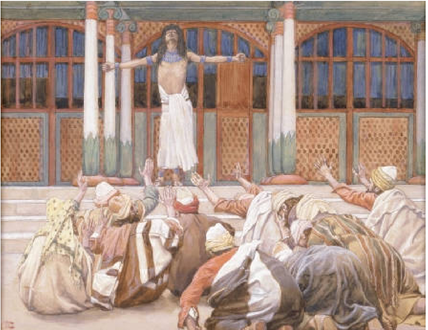
Afbeelding [3] : Jozef maakt zichzelf aan zijn broeders bekend. Schilderij door James Tissot, ca. 1896-1902

Tot zijn broers zei hij, nadat hij zich aan hen bekend had gemaakt: