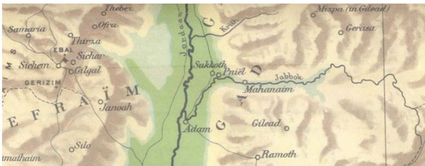
Kaart [2] : Ligging van Sukkoth in het Overjordaanse