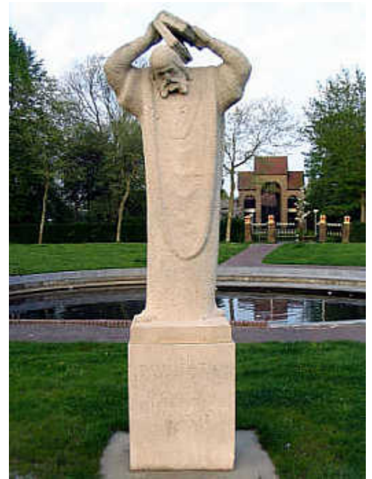
Standbeeld van Bonifatius in het Bonifatiuspark te Dokkum. Hij werd in de buurt van Dokkum vermoord.

Bonifatius is een man geweest, die beheerst werd door een grote gedachte, namelijk de eenheid van de Westerse kerk, welke verloren dreigde te gaan, te herstellen. Hij bezat in hoge mate de gave van organiseren. Bonifatius is de vader geweest van de eenheid der Rooms-katholieke kerk. Zijn werk was voor de organisatie van de westerse kerk van enorm belang. Hij heeft bijgedragen aan de groei van de culturele eenheid van West Europa.