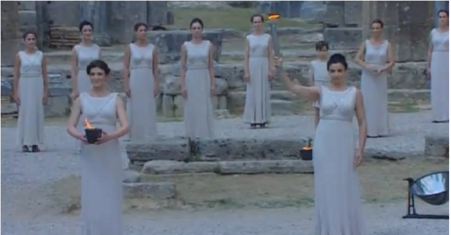
Foto: Openingsceremonie in Olympia, 2012. De hogepriesteres (met toorts) heeft de fakkel ontstoken in de parabolische spiegel (rechts).

Na het ontsteken van de toorts door de hogepriesteres gaan de priesteressen in processie naar het stadion. Daar ontsteekt de hogepriesteres met de brandende toorts de fakkel van de eerste loper en geeft hem, de sporter, een olijftak. Dit is de start van de fakkeltocht, die uiteindelijk voert naar de organiserende stad ergens in de wereld.