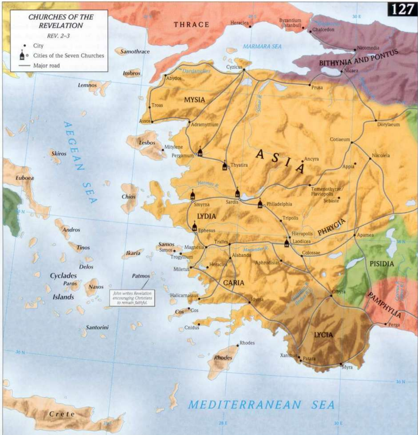
Kaart [1] : In Efeze was één van de gemeenten genoemd in Openbaring