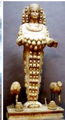
Afbeeldingen: links: Theater te Efeze; midden: tempel van Artemis; rechts: Artemisbeeld

De apostel Paulus was de stichter van de christelijke gemeente in deze stad. Zijn eerste korte bezoek aan deze stad was in het voorjaar van 54 na Chr. Hij kon niet lang blijven want hij moest op een vastgestelde datum in Jeruzalem zijn om een gelofte in te lossen. (Hand. 18:19-20) Maar later bracht hij bijna drie jaar door in Efeze, jaren van toegewijde en intensieve evangelieverkondiging. (Hand. 19:8-10)