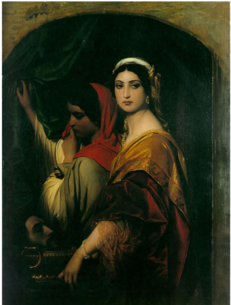
'Herodias', schilderij van Paul Delaroche [2]

Herodias was de vrouw van Herodes Antipas , bestuurder van Galilea en Perea. Zij liet haar dochter Salome om het hoofd van Johannes de Doper vragen. Zie Matth. 14:3-12; Marc. 6:17-28; Luc. 3:19.