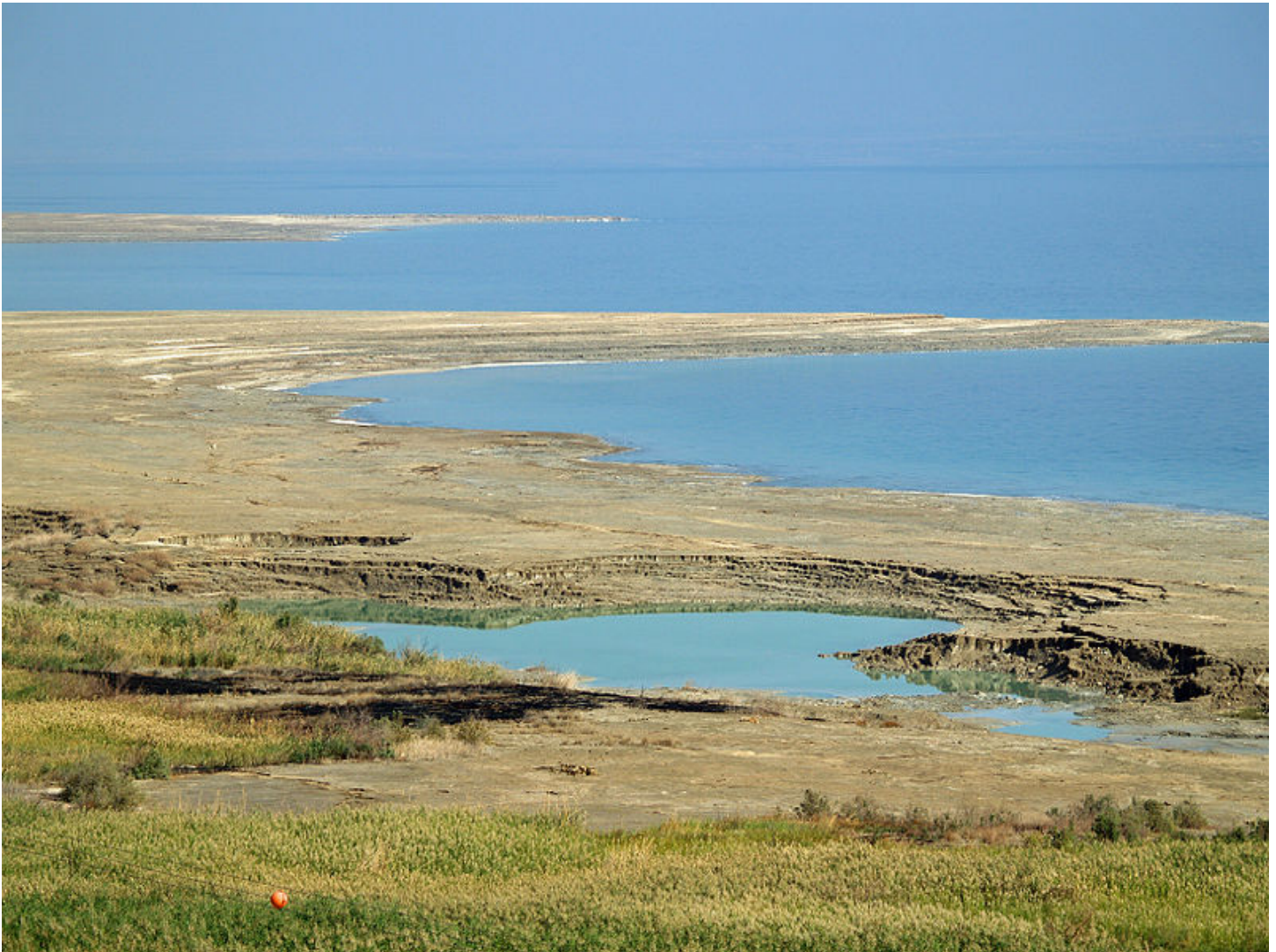
Dode zee. Foto door David Shankbone, dec. 2007 [1]