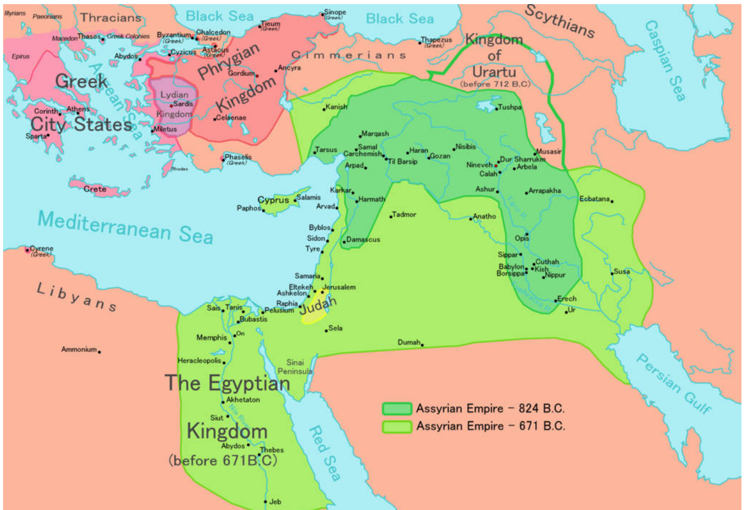
Kaart [5] : koninkrijk van Juda omringd door het Assyrische rijk in 671 v.Chr.

De laatste grote Assyrische koning was Assurbanipal, die regeerde 669 - 627 v. Chr. In 650 was het Assyrische rijk qua omvang op zijn hoogtepunt [2] .