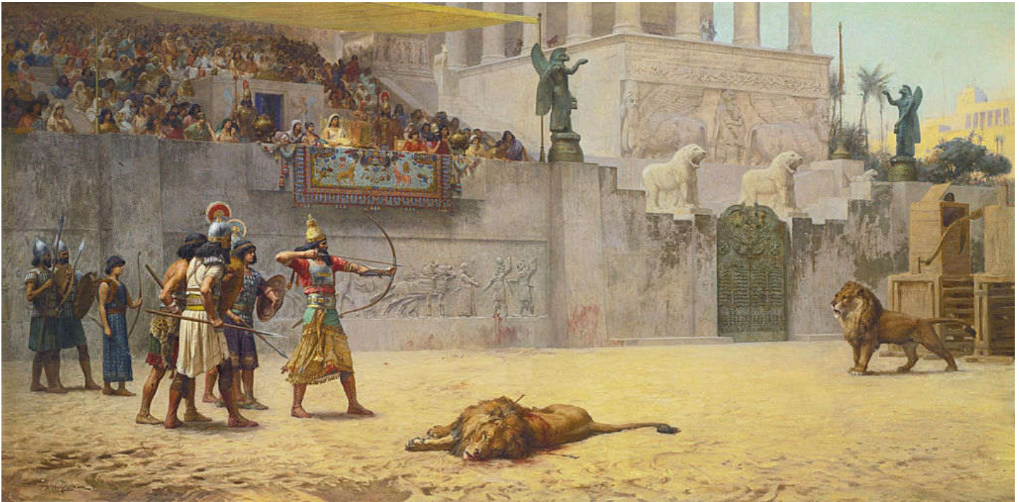
'De verstrooiing van een Assyrische koning', olieverfschilderij van Frederick Arthur Bridge, 1878 [6]

De bouwkunst kenmerkte zich door grote terrassen, waarop paleizen en torens zich verhieven; de beeldhouwkunst uitte zich in zeer grote tot zeer kleine reliefs.