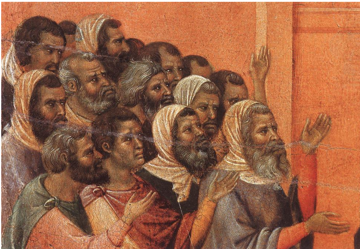
Afbeelding: Christus beschuldigd door Farizeeën. Schilderij van Duccio di Buoninsegna

Lu 16:15 En Hij zei tot hen: U bent het die u rechtvaardig voordoet voor de mensen, maar God kent uw harten ; want wat hoog is bij mensen, is een gruwel voor God.