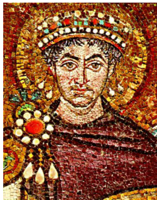
In purperen mantel gehulde Byzantijnse keizer Justinianus (463-565 na Chr.)

De Heer Jezus werd, om Hem als de Koning der Joden bespottelijk voor te stellen, een purperen mantel omgedaan.