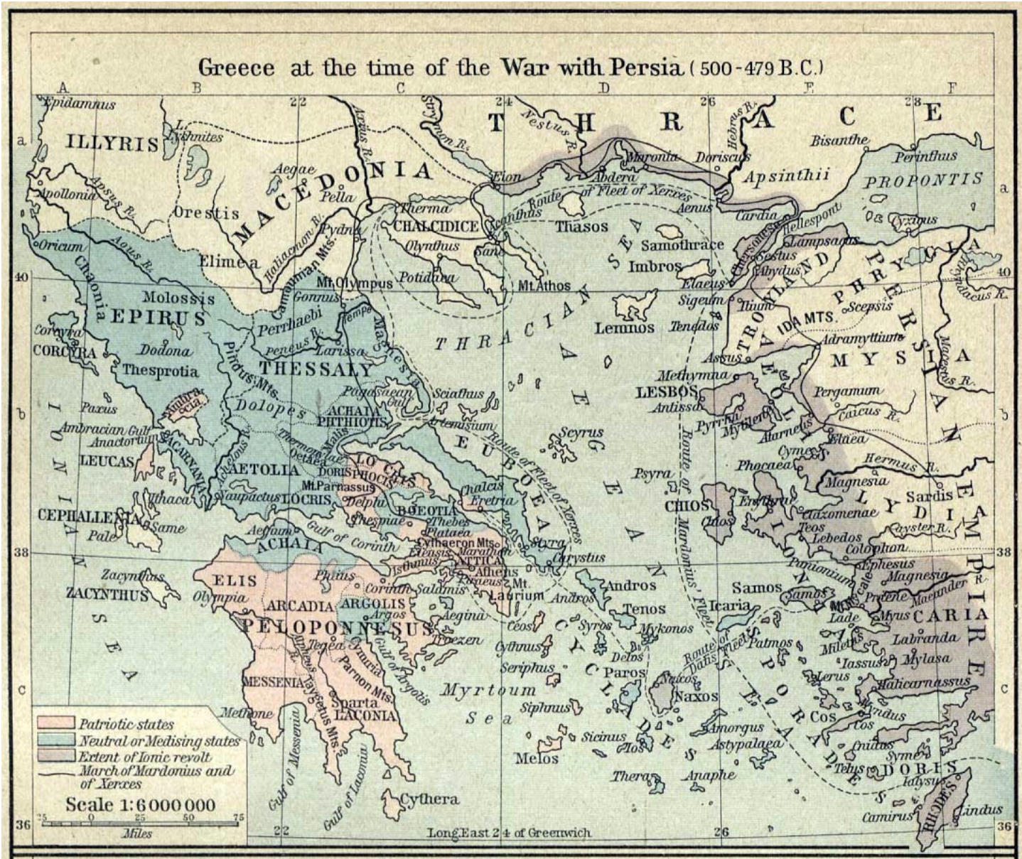
Kaart [4] : Griekenland ten tijde van de oorlog met de Perzen, 500 - 479 v.C.