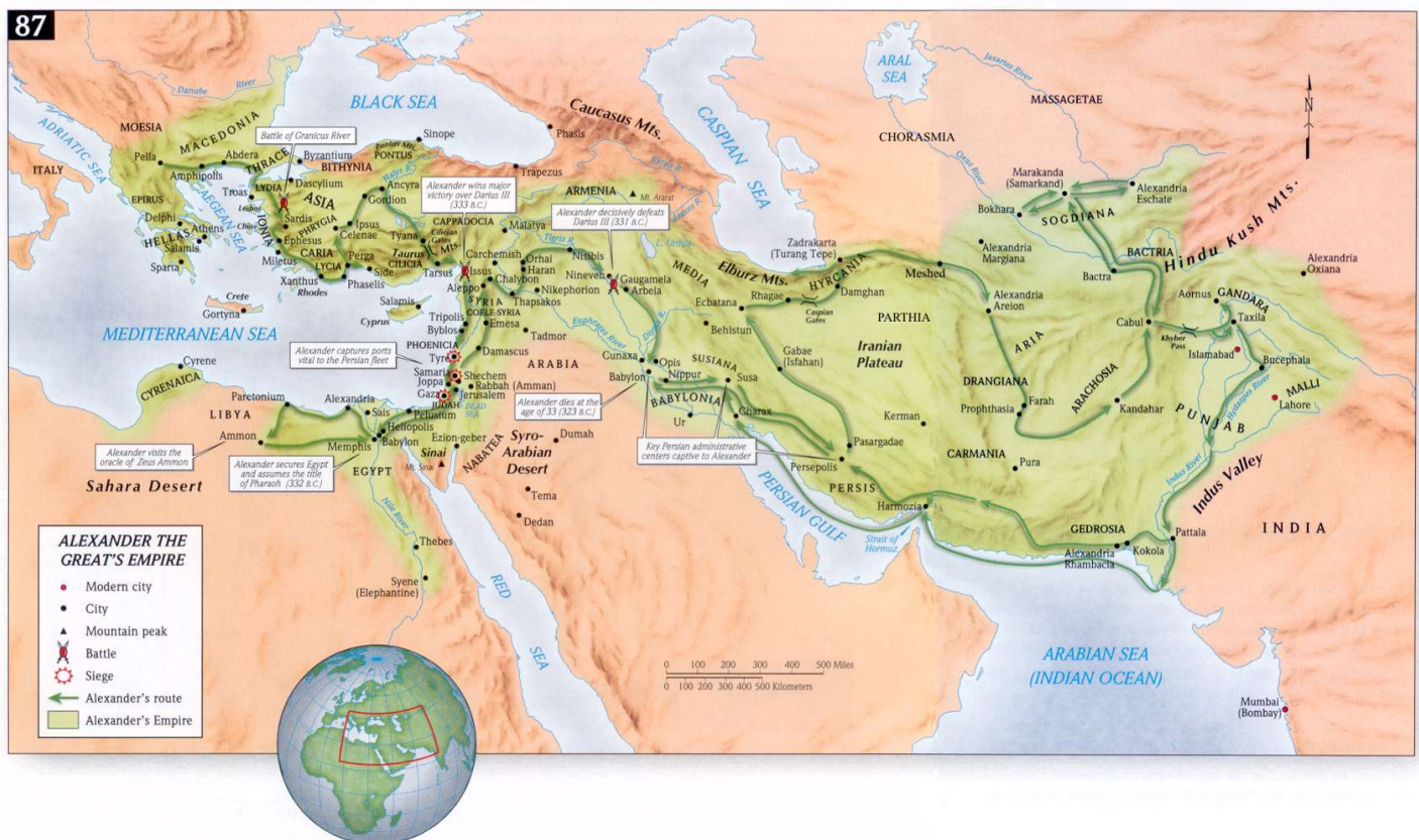
Kaart [3] : Rijk van Alexander de Grote. (Klik op de kaart om deze te vergroten)

Alexander de Grote begint een veldtocht tegen erfvijand Perzië, dat een groot gebied in het Midden-Oosten beheerst.